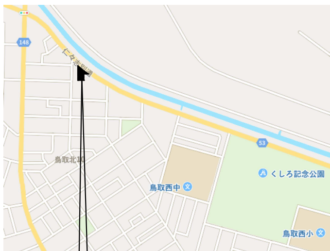
釧路市鳥取北9丁目20-30